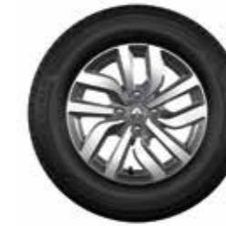
Rin de aluminio Premia 15" diamantado