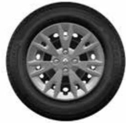
Embellecedor Eptius 15"