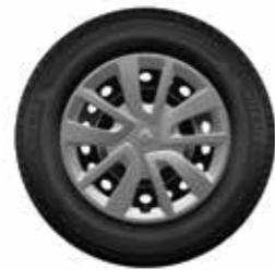
Embellecedor Magiceo 15"