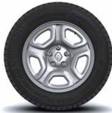
Rines 16" de lámina