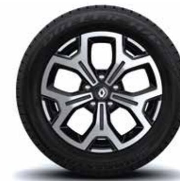
Rin 17" Aluminio - Diamantados