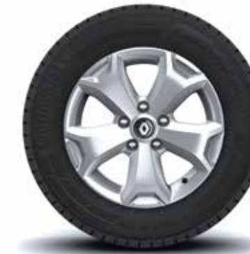
Rin 16" Aluminio