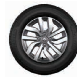
Rin de aluminio Premia 15" diamantado