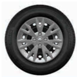
Embellecedor Eptius 15"