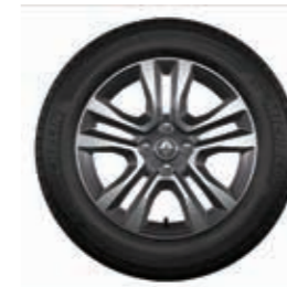
Rin de aluminio Jogger 16" diamantado